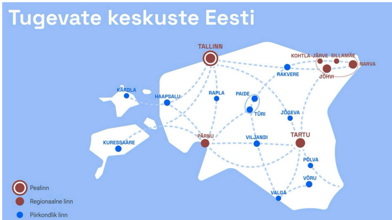
Joonis 1: Eesti kaart 2050 strateegiast, kus keskusi markeerivate ringide pindalad on üsna suvalised

Vajalik on kaardi täpsus ja korrektsus, sest muidu on ekslikud sellest tulenevad järeldused strateegia jaoks. Strateegias oleval Eesti kaardil (vt joonis 1) on sama suurte punaste ringidega tähistatud Tartu ja Tallinn, samas õigesti markeerib pealinna suuremat tähtsust ja gravitatsioonijõudu (seal asuvad riigi võtmeinstituutsioonid, transpordisõlmed, peakorterid jne) selle ümber nn oreool (täiendav punane ring). Pärnu, Jõhvi, Narva on kaardil pisut väiksemad, Kohtla-Järve ja Sillamäe veelgi väiksemad. Suuremate siniste ringidega on tähistatud Võru, Viljandi, Türi, Paide, Rakvere, Haapsalu, Kuressaare. Väiksemate siniste ringidega on tähistatud Kärkla, Rapla, Jõgeva, Põlva, Valga. Kaart, mis näitab linnade suuruseid ilma rahvaarvu õiget suurust edasi andmata, on ekslik ja valedele järeldustele kallutav.