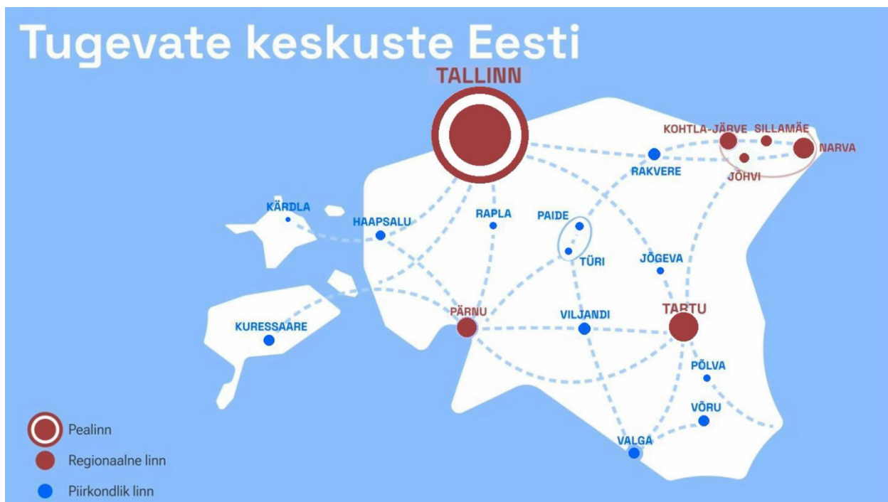
Joonis 2: Eesti kaart, kus keskusi markeerivate ringide pindalad vastavad korrekttselt nende suurusele

Kokkuvõtvalt: Palume muuta joonist „Tugevate keskuste Eesti“ selliselt, et linnade suurused oleksid markeeritud rahvaarvuga õigemates proportsioonides, mis loob eelduse regionaalse arengu kavandamisel õigemate ja proportsionaalsemate otsuste tegemiseks.